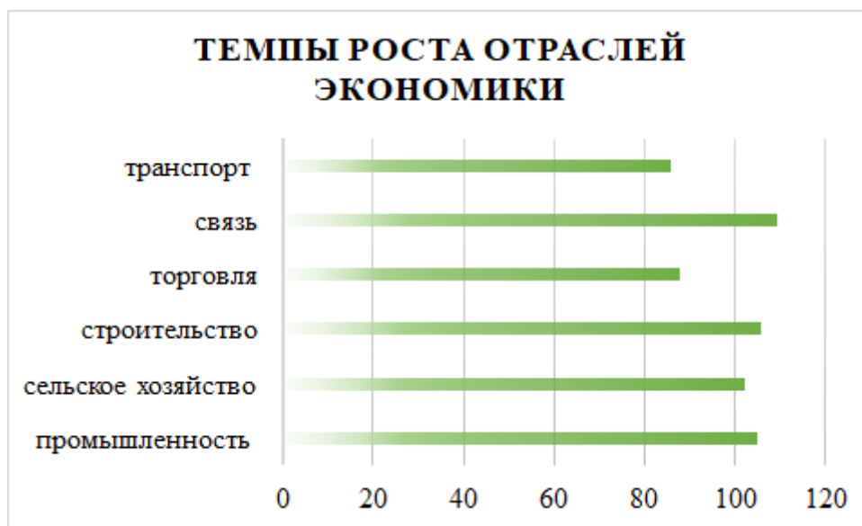
Диаграмма 1.1. Темпы роста отраслей экономики за первый квартал 2020 года, в процентах

Главной тенденцией стал рост мировых цен на нефть. В результате рост ВВП за первый квартал 2020 года составил ... %. Из-за ситуации с коронавирусом наблюдается сокращение ВВП в последующих кварталах до ... %. Помимо этого, за первый период 2020 года краткосрочный экономический индикатор вырос на ...%, это характеризует увеличение объемов производства в 6 отраслях: в промышленности ... %; машиностроении ... %; торговле ... %; обрабатывающей промышленности ...% и строительстве ... %. Инвестиции в основной капитал возросли на ... %.