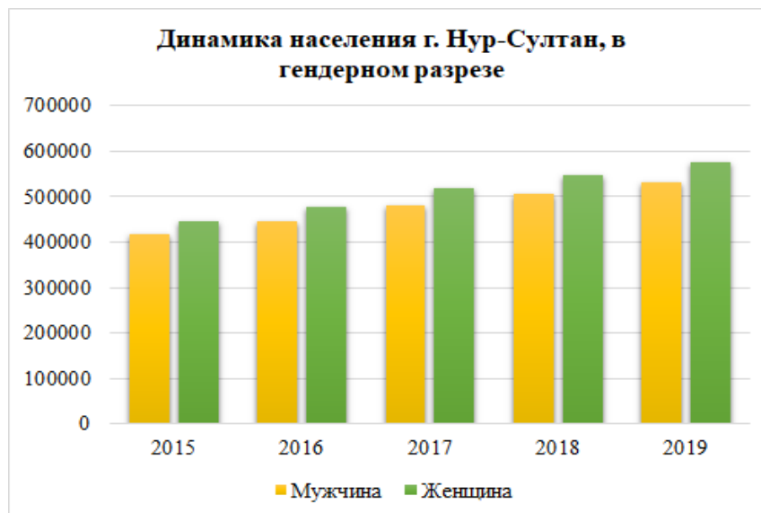
Диаграмма 2.1.2 Динамика населения г. Нур-Султан, в гендерном разрезе

Средний возраст населения 29,8 лет. Средняя продолжительность жизни 76 лет.