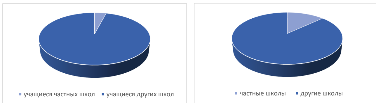
Диаграмма 2.1 «Количество школ по видам и численность учащихся»

Дошкольным образованием в Шымкенте охвачено [ ] детей, обучающихся в [ ] дошкольном учреждении ([ ] государственных и [ ] частных). [ ] учащихся дошкольных учреждений являются воспитанниками частных учреждений. На сегодняшний день в городе дошкольным воспитанием и обучением охвачено из [ ] детей [ ] [ ] в возрасте от 3 до 6 лет.