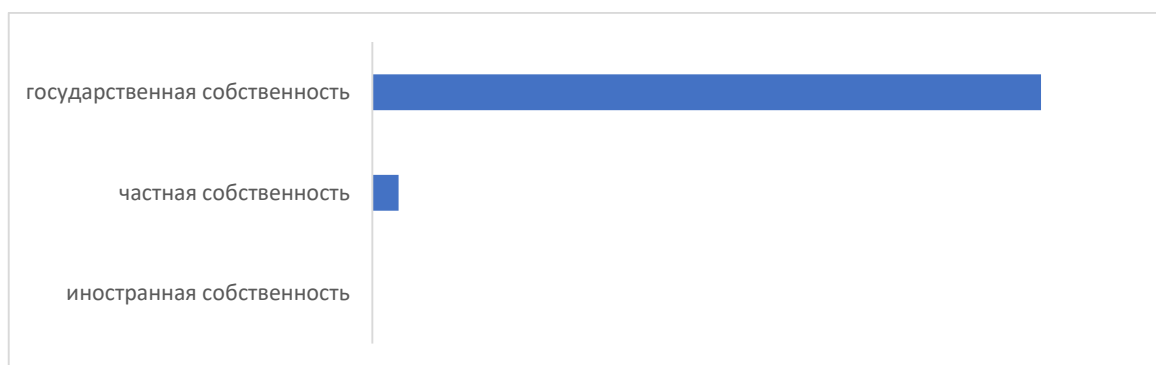
Диаграмма 2.5 «Объем оказанных услуг в области основного и общего среднего образования по формам собственности в 2019 г., тыс.тенге»

Школы, ориентированные на начальные и средние классы, стремятся к максимизации услуг и их качества в сфере дошкольного, начального и последующего образования, вплоть до 9-го класса. Это различного рода углублённое изучение общеобразовательных предметов, иностранных языков, кружки, секции и прочее. Их цель - учебный комфорт и время, для родителей ученика, для принятия решения о будущем их ребёнка и о будущей его специализации. Данные школы в своей политике и развитии придерживаются того факта, что закончив 9-ый класс, их ученики уходят в другие специализированные школы, зарубежные колледжи, которые в свою очередь обеспечат им обучение впоследствии в необходимых для них ВУЗах или зарубежных колледжах. Практически во всех данного типа частных школах есть выпускные 10-ые и 11-ые классы, но они не являются целевыми для получения доходов от своих услуг.