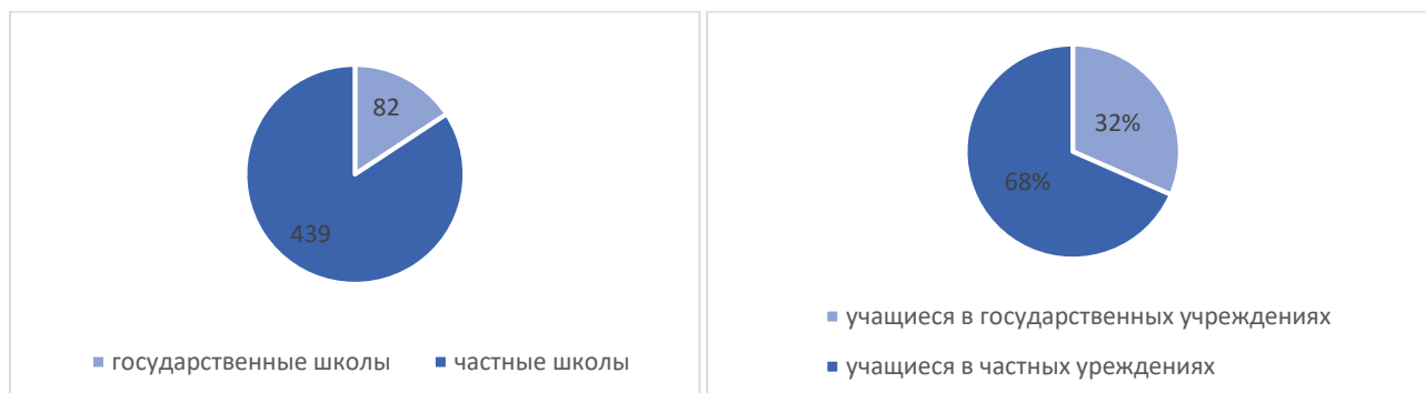
Диаграмма 2.2 «Количество дошкольных учреждений»

Дошкольным образованием в Шымкенте охвачено [ ] детей, обучающихся в [ ] дошкольном учреждении ([ ] государственных и [ ] частных). [ ] учащихся дошкольных учреждений являются воспитанниками частных учреждений. На сегодняшний день в городе дошкольным воспитанием и обучением охвачено из [ ] детей [ ] [ ] в возрасте от 3 до 6 лет.